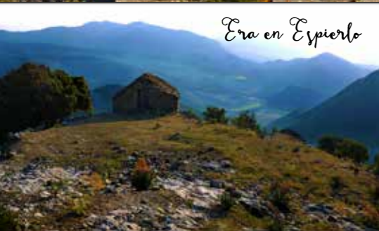
Era en Espierlo