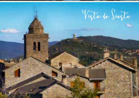
Vista de Sieste