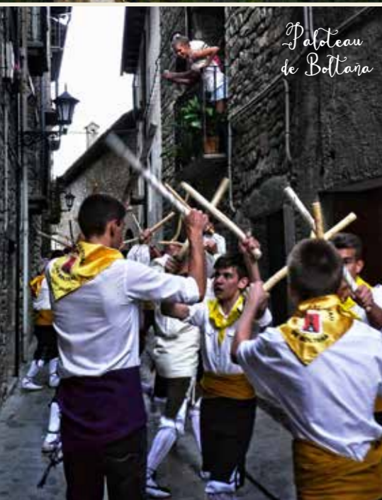
Paloteau de Boltaña