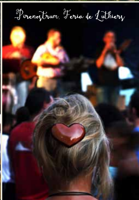
Pirenostrum. Feria de Luthiers

B OLTANA es una de las poblaciones más importantes del Pirineo Aragonés. El encanto de sus calles, el calor de su gente y la bondad de su clima (benigno y estable todo el año), hacen de Boltaña un lugar ideal para disfrutar de unos días de descanso en plena naturaleza.